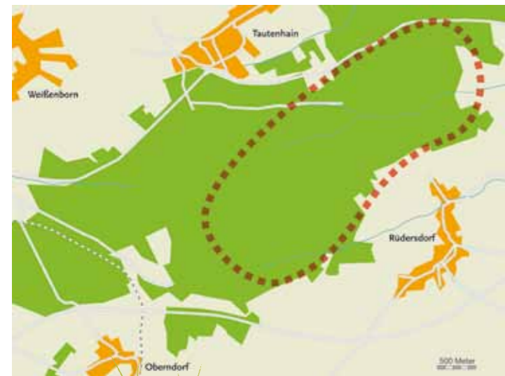
Ungefähre Lage der DBU-Naturerbefläche Himmelsgrund im Tautenhainer Wald