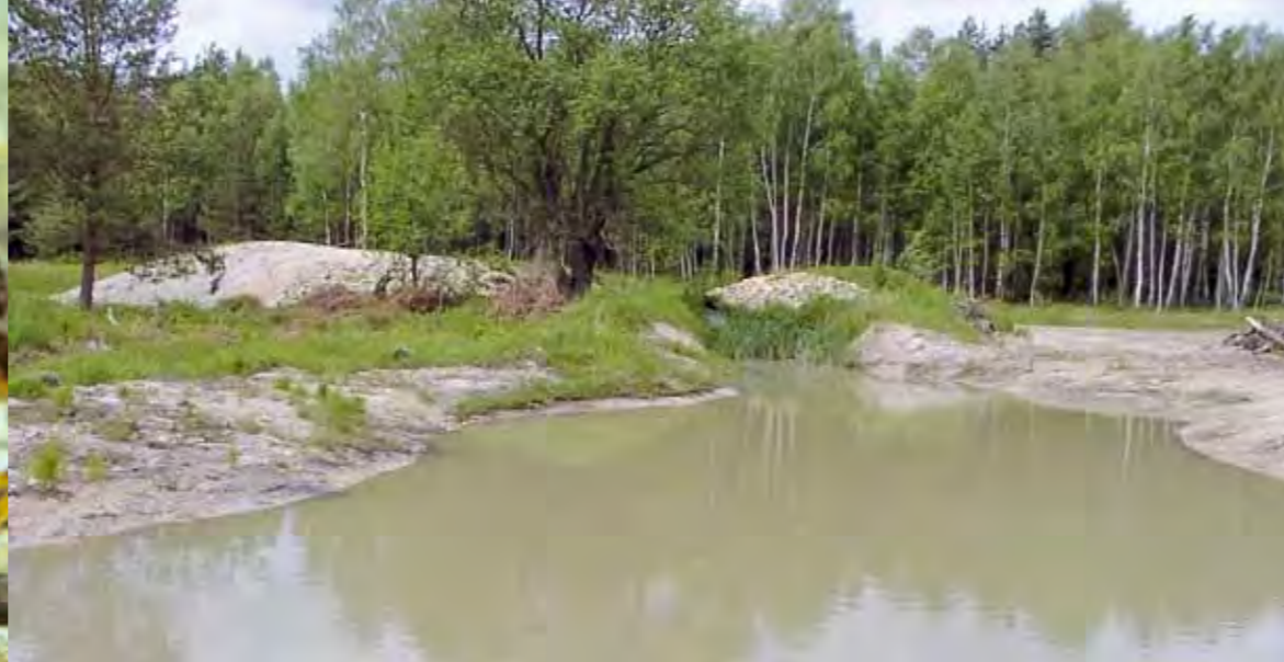
Neu angelegtes Kleingewässer