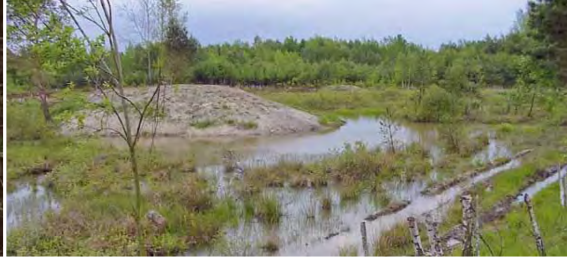
Kleingewässer mit stark schwankendem Wasserstand